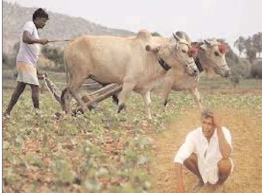
పంట అధికారికంగా అమ్ముకోలేక నానా ఇబ్బందులు పడుతున్నారని భూ యజమానులకు మాత్రం ముందుగానే చేతికి అందుతోంది. కష్టపడి పనిచేసే రైతులకు ఎక్కడా సహాయం అందడం లేదు. వ్యవసాయమే తప్ప ఇతర పని చేయలేని కౌలు

నిజామాబాద్, జూలై 17 (ఆర్ఎన్ఎం): కౌలురైతుల పరిస్థితి దారుణంగా ఉంది. ప్రభుత్వ ఉద్యోగులు, వ్యాపారులు, ఇతర రంగాలకు చెందిన వారికి వ్యవసాయం చేసే ఆసక్తి లేకపోవడంతో పాటు సాగు కష్టాలను ఎదుర్కొనే పరిస్థితులు లేక తమ భూములను కౌలుకు ఇచ్చేస్తుంటారు. ప్రభుత్వం ఎకరాకు రూ.5వేల చొప్పున రెండు విడతలుగా అందిస్తున్న రైతు బంధు సాయం పట్టాదారైన రైతుల ఖాతాల్లోనే జమ అవుతోంది. పంటను సాగు చేసిన కౌలు రైతు పేరు ఎక్కడా లేకుండా పోయింది. ప్రభుత్వం అందిస్తున్న రైతు బంధులో కౌలు రైతు ఊస్ లేకపోవడంతో వారి పరిస్థితి దయనీయంగా మారింది. పంటను సాగు చేసే ఎరువులు, కలుపు తీయాలిసే పరిస్థితుల్లో పెట్టుబడి కోసం ప్రైవేటు వ్యాపారులను ఆశ్రయిస్తున్నారు. బ్యాంకులు సైతం కౌలు రైతులకు రుణాలు ఇవ్వడం లేదు. గతంలో కౌలు రైతులకు రుణ అర్హత కలిగిన కార్డులను జారీ చేసేవారు. తెలంగాణ ప్రభుత్వం కొంత కాలంగా భూములన్నీ ఆన్లైన్ లో నమోదు చేసింది. కొత్తగా జారీ చేసిన డిజిటల్ పాస్ పుస్తకాల్లో పట్టాదారు పేరు మినహా ఇతర కాలం ఎక్కడా లేదు. దీంతో కౌలు రైతులకు శాశ్వతంగా అడ్డుకట్టపడింది. పెరుగుతున్న పెట్టుబడులు రోజురోజుకూ పంట పెట్టుబడులు పెరుగుతున్నాయి. సొంత భూములు లేక కౌలుపైనే ఆధారపడి వ్యవసాయం చేస్తున్న రైతులను ప్రభుత్వం గుర్తించడం లేదు. పంటసాగు పెట్టుబడి కోసం ప్రభుత్వం నుంచి సహకారం అందక, పండించిన