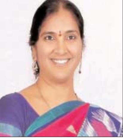
అవసరం లేదన్నారు. ప్రభుత్వ ప్రతిష్టాత్మకంగా చేపట్టిన హరితహారాన్ని ఉధృతంగా సాగిస్తామని, ప్రజల్లో నుంచి స్పందన వస్తోందని అన్నారు. ఇది సానుకూల పరిణామమని అన్నారు. గతం కన్నా ప్రస్తుతం చైతన్యం పెరిగిందని తనను కలసిన

మొదటి, జూలై 17 (ఆర్ఎన్ఎం): మానవాళి మనుగడకు మొక్కల పెంపకమే కీలకమని, సమాజంలోని ప్రతి ఒక్కరూ విధిగా మొక్కలు నాటాలని మొదటి ఎమ్మెల్యే పద్మాదేవేందర్ రెడ్డి అన్నారు. మొక్కలు నాటడంతో పాటు వాటి సంరక్షణ కోసం ప్రతి ఒక్కరూ చర్యలు తీసుకోవాలని, గతంలో ఏ ప్రభుత్వం మొక్కలు పెంపకంపై దృష్టి సారించ లేదన్నారు. హరితహారం కార్యక్రమంలో పాల్గొనడంతో పాటు మొక్కలు తమ గ్రూప్ లో ఖాళీ స్థలాల్లో నాటుకోవాలని కోరారు. ఇది నిరంతర ప్రక్రియ అన్నారు. మొక్కలు నాటడం సామాజిక బాధ్యతగా గుర్తించాలన్నారు. నాటి ప్రతి మొక్కను ఏదాని పాటు సంరక్షించాలన్నారు. అందుకోసం ప్రభుత్వం నిధులు మంజూరు చేస్తుందన్నారు. మొక్కలను చంటి బిడ్డలా మారితగా కాపాడుకోవాలన్నారు. బిల్డలో పెద్ద ఎత్తున మొక్కలు నాటి కార్యక్రమం చేపడుతున్నామని అన్నారు. దీనిని నిరంతరంగా కొనసాగించేలా ప్రజల్లో చైతన్యం తీసుకుని వస్తామని అన్నారు. ఇందుకోసం ప్రత్యేకంగా కార్యక్రమం